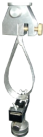
Loop tack (环型剥离)